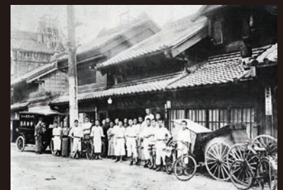
日本橋葺屋町の中西商店 (大正9年)